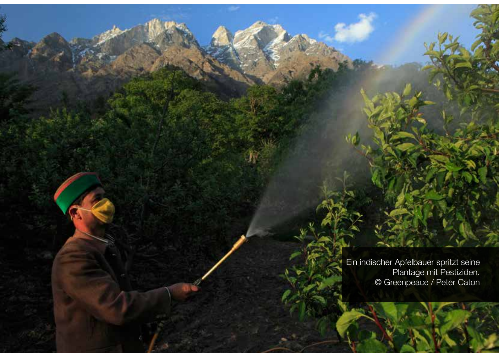
Ein indischer Apfelbauer spritzt seine Plantage mit Pestiziden.