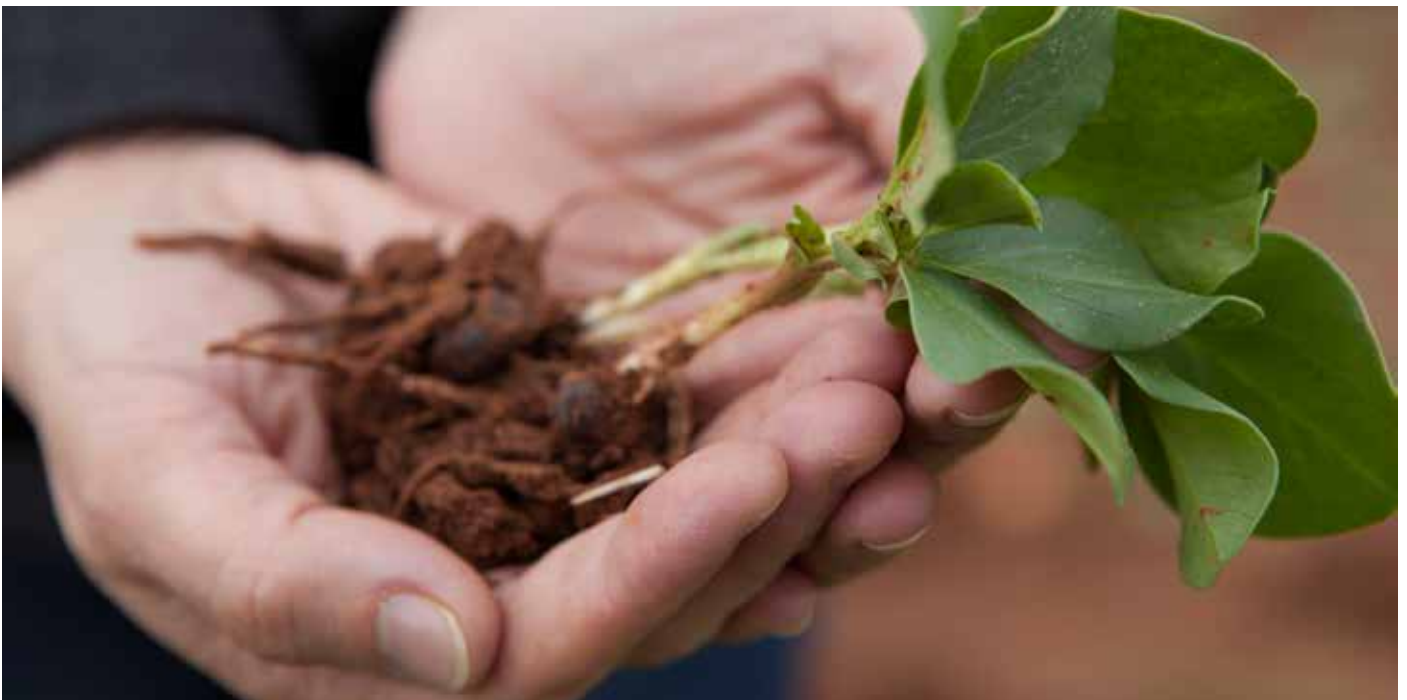
Diese ökologisch aufgezogene Ackerbohne ist in Griechenland heimisch und enthält viel Eiweiss.

Der einzig sichere Weg, unsere Exposition gegenüber giftigen Pestiziden zu verringern, ist die Umstellung auf einen langfristigen und nachhaltigen Ansatz zur Nahrungsmittelproduktion. Dies erfordert rechtsverbindliche, auf nationaler und internationaler Ebene umzusetzende Vereinbarungen über den unverzüglichen Ausstieg aus der Verwendung sämtlicher Pestizide, die für Nichtzielorganismen giftig sind. Eine grundlegende Veränderung unserer landwirtschaftlichen Ausrichtung impliziert einen Paradigmenwechsel weg von der industriellen Landwirtschaft, die nicht ohne chemische Hilfsmittel auskommt, hin zu einer flächendeckenden Einführung der ökologischen Landwirtschaft. Nur so können alle Menschen ausreichend ernährt und die Ökosysteme, in denen wir leben, geschützt werden. Die ökologische Landwirtschaft ist ein moderner und wirksamer Ansatz zur Bewirtschaftung landwirtschaftlicher Flächen, der ohne giftige Chemikalien auskommt und für gesunde und sichere Nahrungsmittel sorgt.