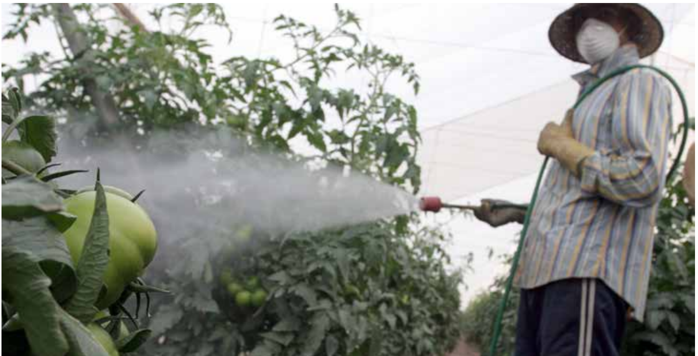
Ein Arbeiter ohne Schutzkleidung, der nur eine Maske aus Papier trägt, sprüht Pestizide auf Gemüse in einem Gewächshaus in Spanien

Auch die in landwirtschaftlichen Gebieten ansässigen Familien von Landwirten sind Pestiziden möglicherweise etwas stärker ausgesetzt als der Durchschnitt der Bevölkerung, weil auf Feldern versprühte Pestizide zu den Wohnstätten dieser Familien abdriften können und Landarbeiter nach der Arbeit kontaminierte Kleidung und Schuhe mit nach Hause bringen. Dies ist im Hinblick auf Säuglinge und Kinder besonders besorgniserregend, weil sie für die toxischen Auswirkungen einiger Pestizide anfälliger sind als Erwachsene (Arcury et al. 2007).