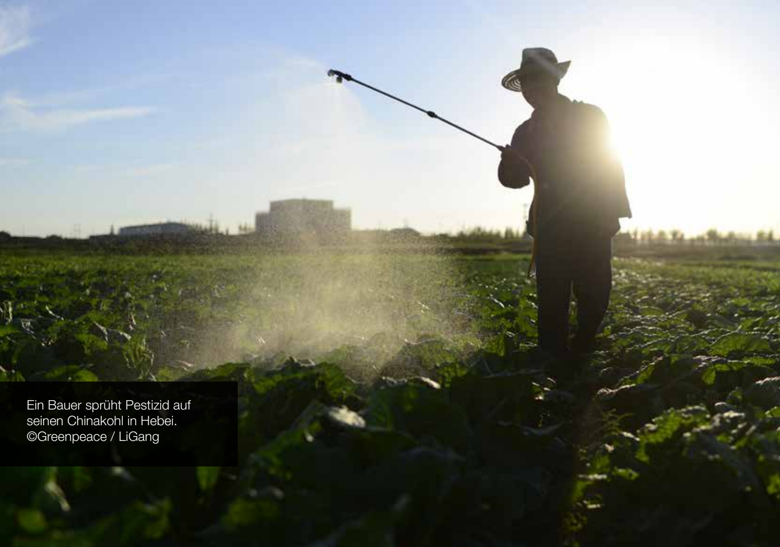
Ein Bauer sprüht Pestizid auf seinen Chinakohl in Hebei.