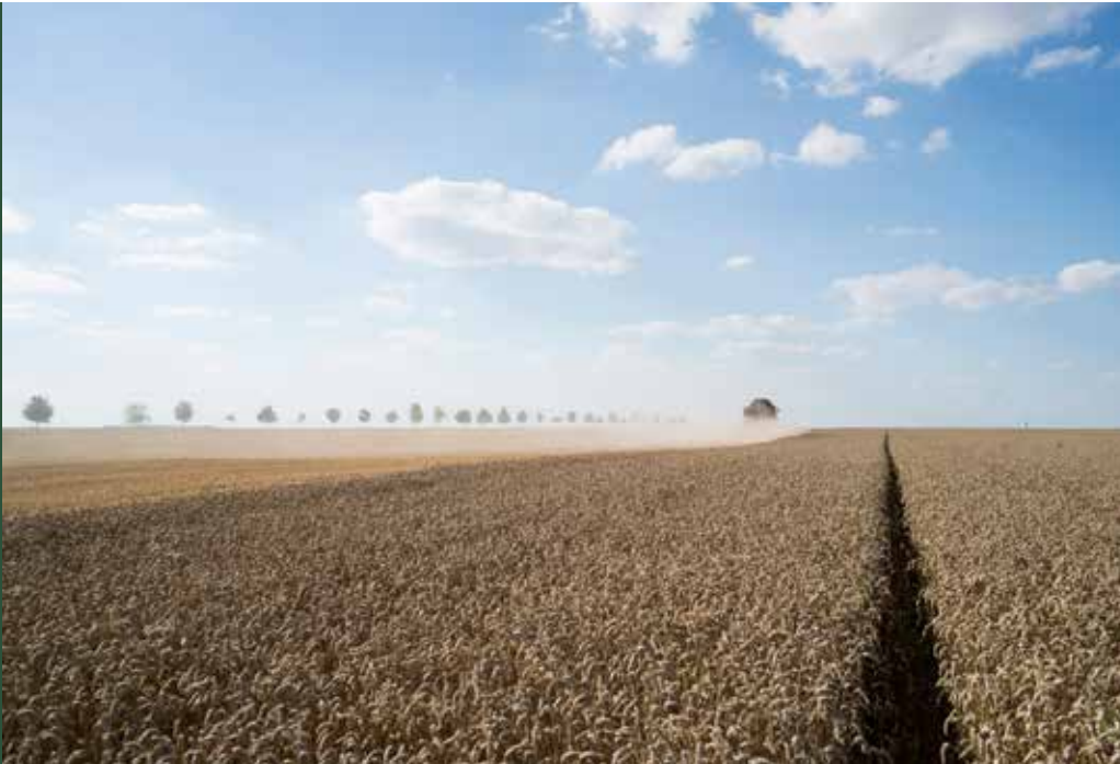
Monokultur-Landschaft in Frankreich.

Im Mittelpunkt dieses Reports steht die Bedrohung der Gesundheit des Menschen durch Pestizide während und infolge ihrer Anwendung. Freilich stellt diese Bedrohung keineswegs das einzige Problem dar, das sich aus unserer übermässigen Abhängigkeit von Pestiziden und den durch sie gestützten, nicht nachhaltigen Systemen der industriellen Landwirtschaft ergibt.