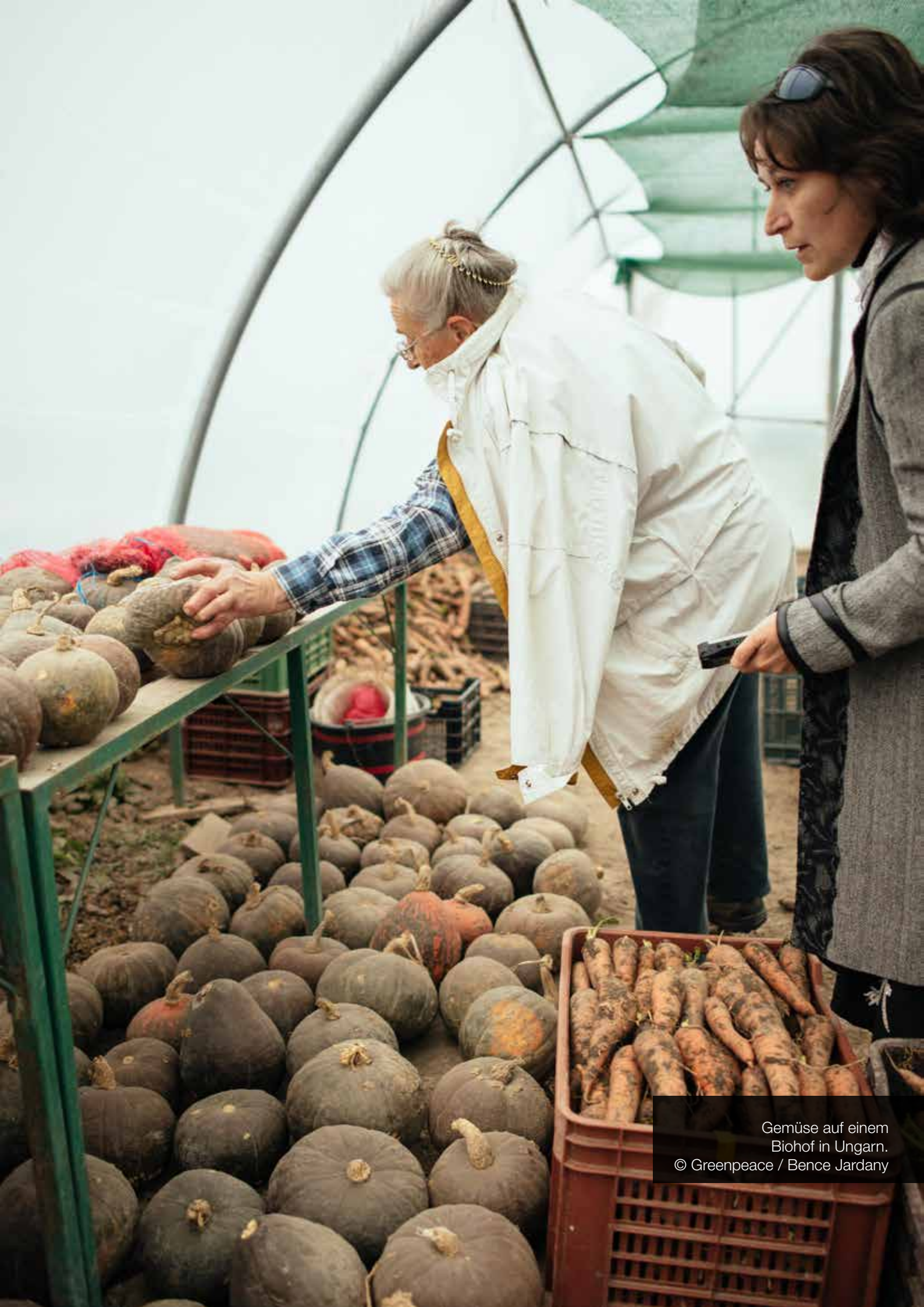
Gemüse auf einem Biohof in Ungarn.