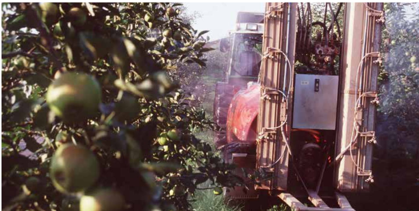
In einer Apfelplantage in der Nähe von Hamburg in Deutschland werden Pestizide ausgebracht.

Studien haben gezeigt, dass die meisten Kinder Pestiziden hauptsächlich über ihre Ernährung ausgesetzt sind. Folglich kann man davon ausgehen, dass Kinder, die Nahrungsmittel aus biologischem Anbau zu sich nehmen, durchweg geringere