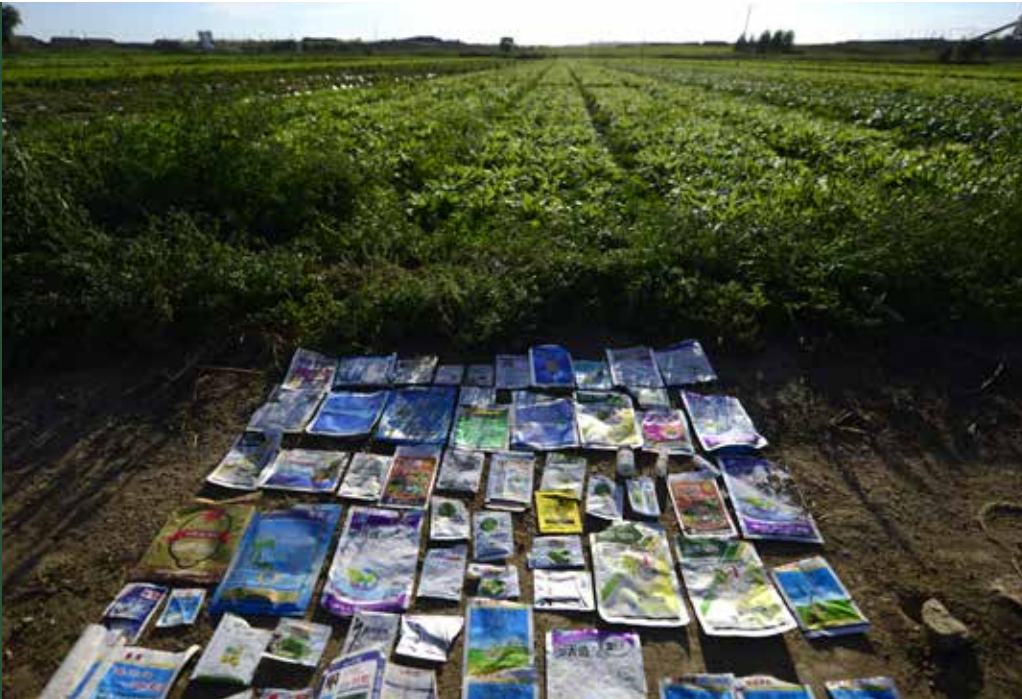
Unterschiedliche Pestizidverpackungen, die auf einem Salatfeld gesammelt wurden, Hebei. / China

Die Gesundheit der Beschäftigten in der Landwirtschaft sowie der breiteren Bevölkerung, einschliesslich Kindern, wird bedroht durch die Pestizide, die in landwirtschaftlichen Gebieten zum Einsatz kommen, und potenziell durch jene, die in unserer Nahrung zu finden sind.