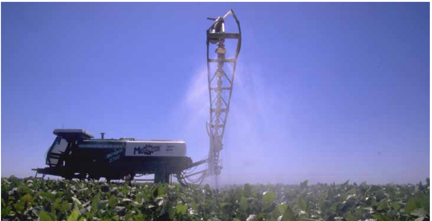
In Argentinien wird gentechnisch veränderte Soja bespritzt.

einer pränatalen Chlorpyrifos-Exposition fest. Die Gehirnstruktur von 40 dieser Kinder zwischen 6 und 11 Jahren wurde mithilfe von Magnetresonanztomografie (MRT) untersucht. Kinder, die im Mutterleib höheren Chlorpyrifos-Konzentrationen ausgesetzt waren, wiesen mehr Anomalien in der Gehirnstruktur auf, und zwar in jenen Hirnarealen, die mit bestimmten kognitiven und verhaltensbezogenen Prozessen in Zusammenhang stehen. Veränderungen der Gehirnstruktur zeigten sich auf der gesamten Gehirnoberfläche, wobei manche Bereiche eine anormale Vergrößerung aufwiesen und andere ausgedünnt waren. Zusammenhänge zwischen einer pränatalen Chlorpyrifos-Exposition sowie einer veränderten Gehirnstruktur und Defiziten in der kognitiven Entwicklung deuteten auf die Langfristigkeit dieser neurotoxischen Auswirkungen bis in die mittlere und späte Kindheit hin. Zudem decken sich diese Erkenntnisse mit den Ergebnissen kontrollierter Laborexperimente, die darauf hindeuten, dass ähnlich nachteilige Auswirkungen bei Tieren möglicherweise irreversibel sind (Rauh et al. 2012).