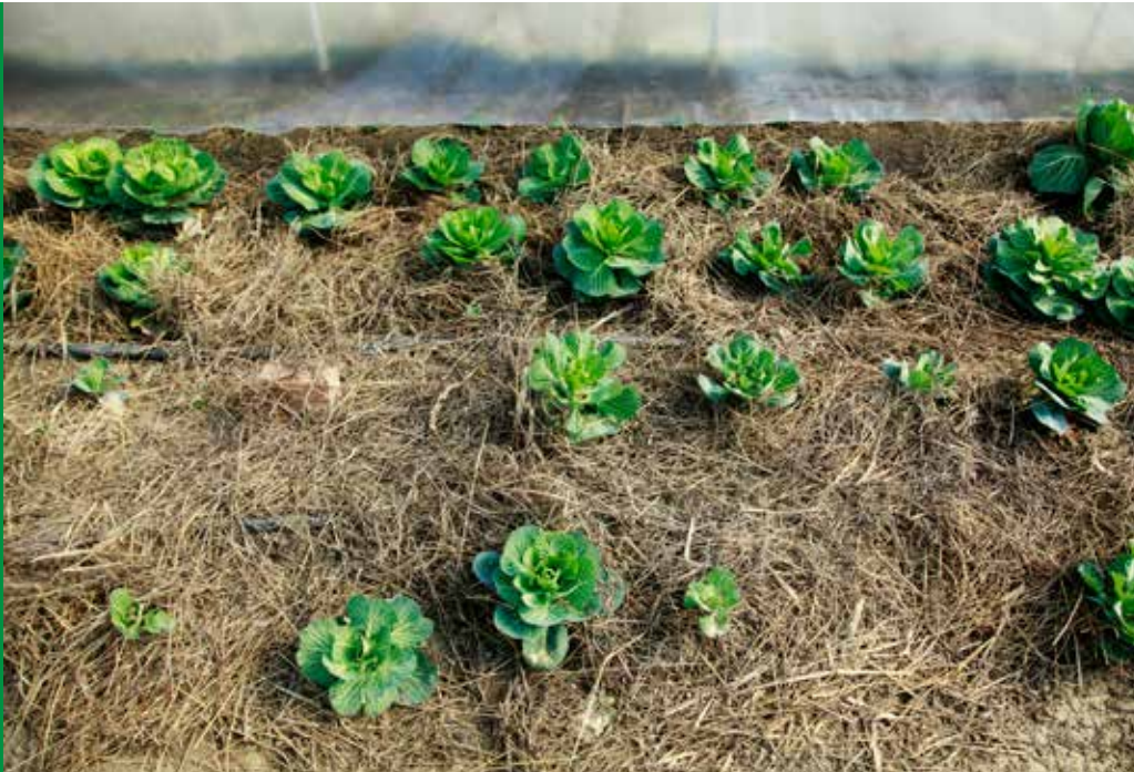
Gemüse auf einem Biohof in Ungarn.

Angesichts der Tatsache, dass es eine derart breite Palette an Pestiziden gibt, die mit nachteiligen Auswirkungen auf die Gesundheit und auf Ökosysteme im Allgemeinen verbunden sind, können Strategien, die lediglich auf die Reduktion des Einsatzes ausgewählter Pestizide zielen, den Schutz der menschlichen Gesundheit nicht gewährleisten. Der vollständige Ausstieg aus der Anwendung synthetischer Pestizide durch eine weltweite Umorientierung weg von der industriellen Landwirtschaft hin zu ökologischen Anbaumethoden ist für die Vermeidung der mit Pestiziden verbundenen Gefahren und Risiken von entscheidender Bedeutung.